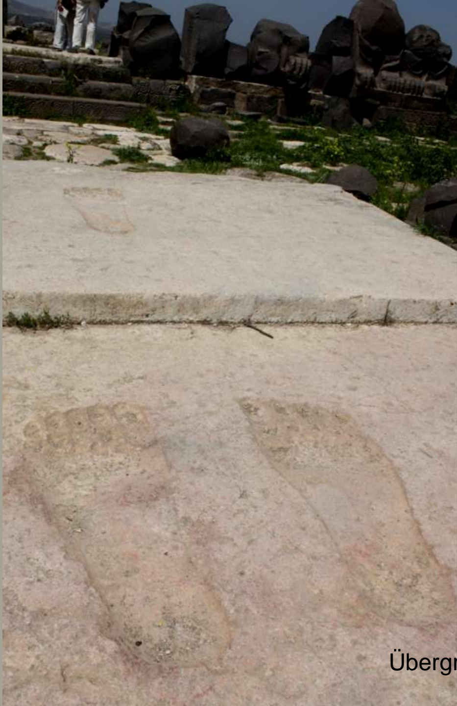
Übergroße Füße auf der großen Freitreppe