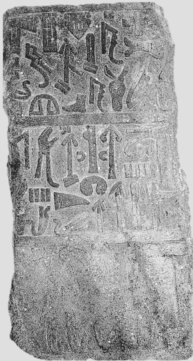
Ishtar-Stelen aus Ain Dara im Nationalmuseum in Aleppo