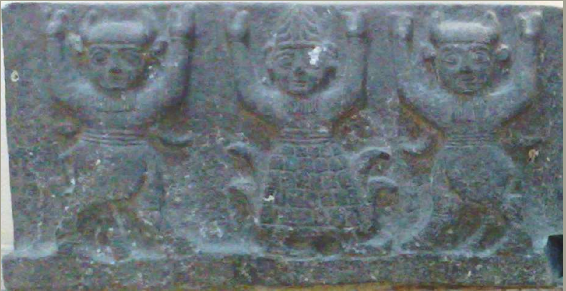
Sockelplatten mit Berggott und Stiermenschen