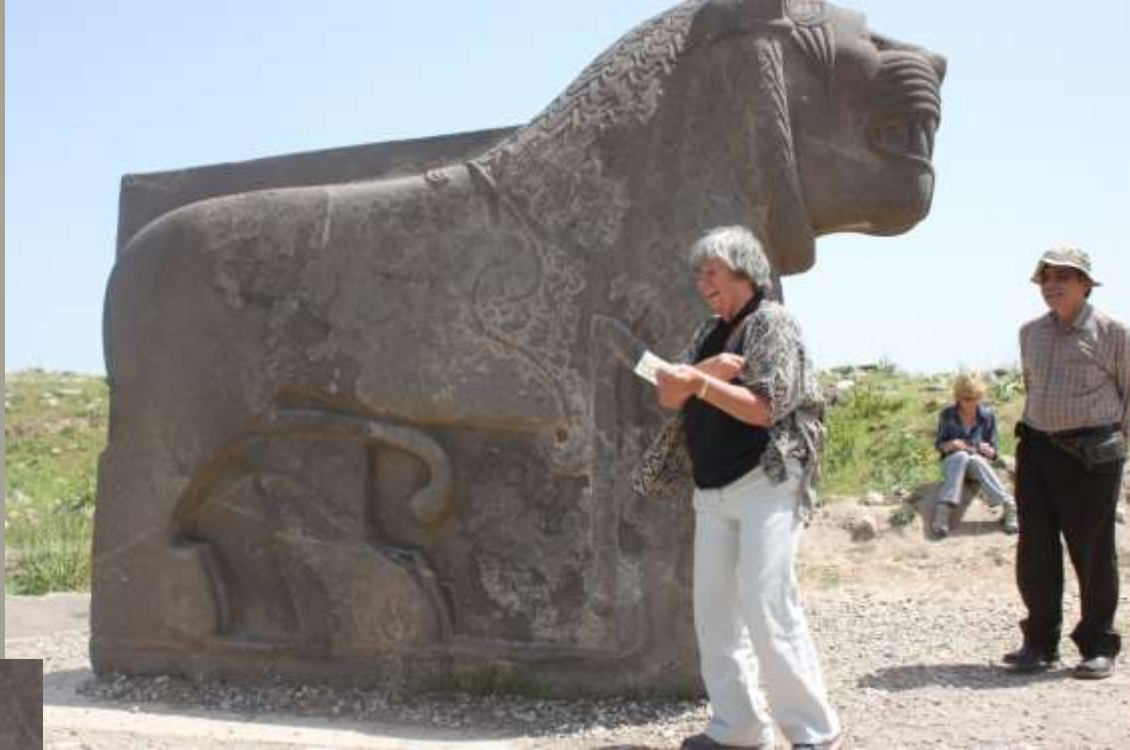
LÖWE VON AIN DARA