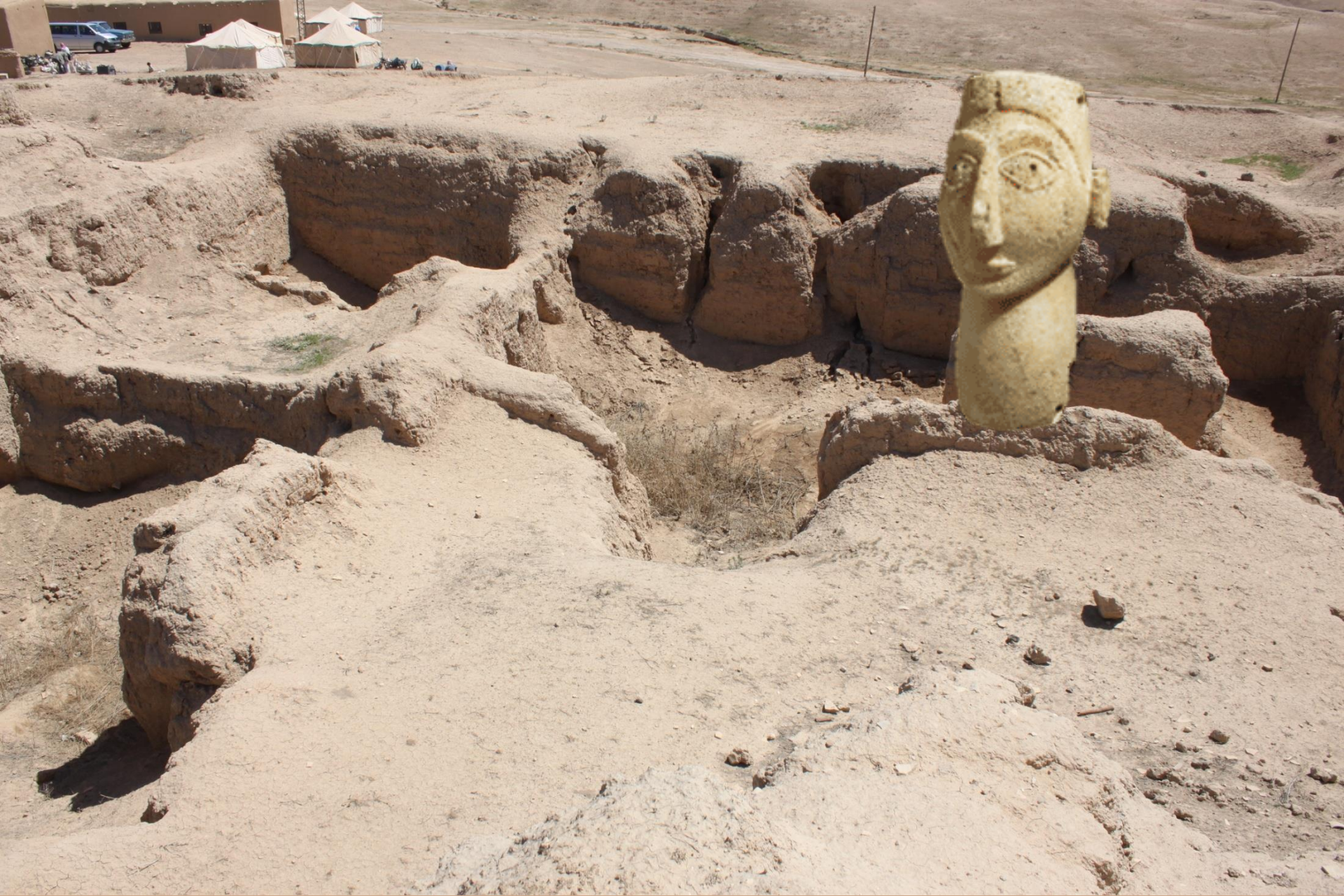
Tell Brak- Besiedlung seit dem 6. Jt. V. Z.