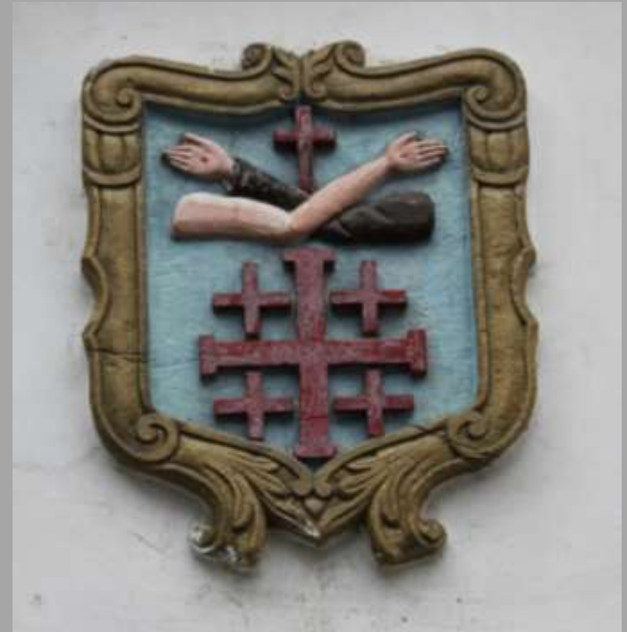
Franziskanerorden im Bürgerhaus aus dem 16. Jh.