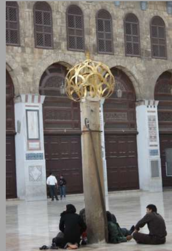
Omayyadenmoschee mit Pilgern aus dem Iran