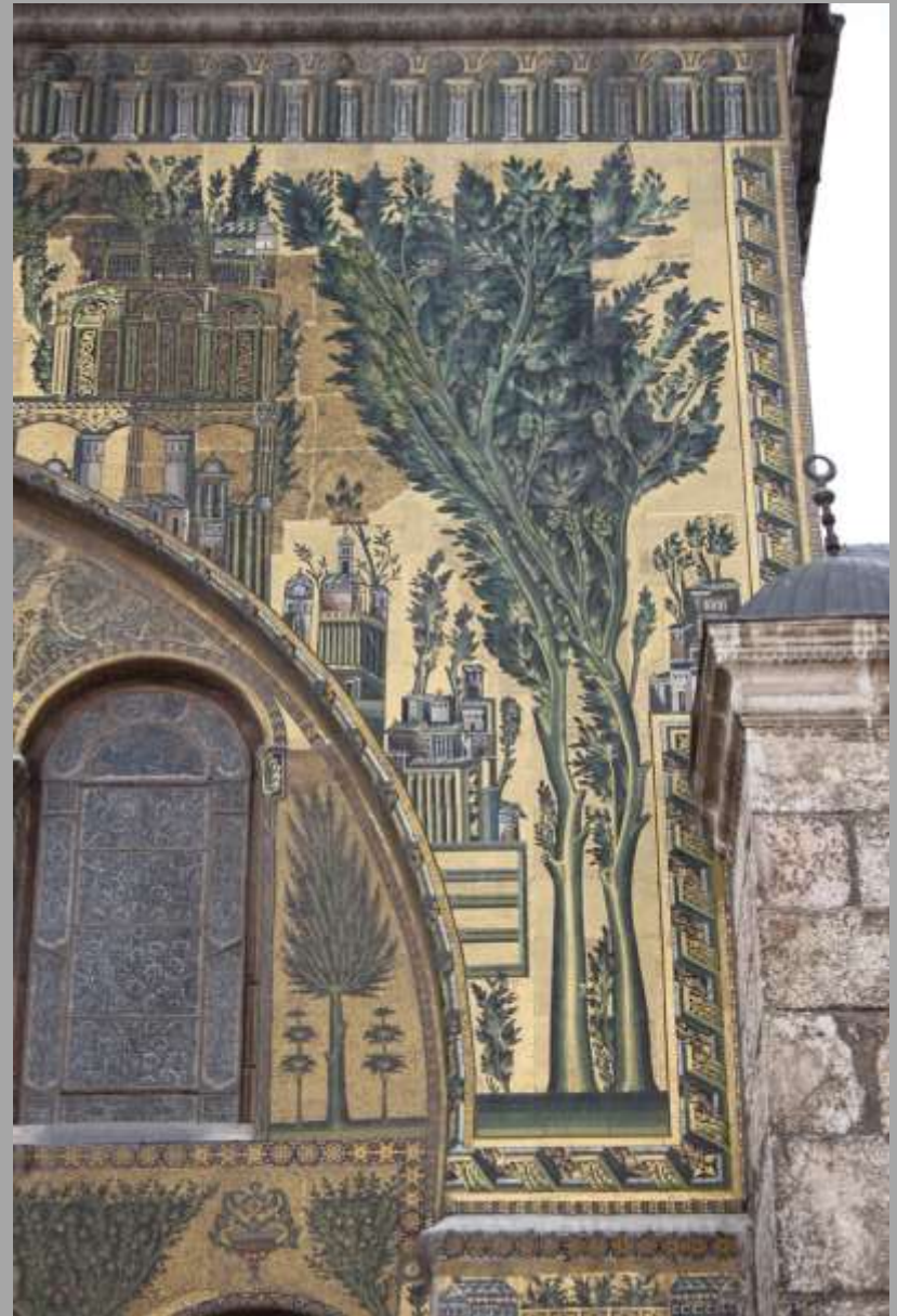
Mosaiken der Omayyadenmoschee