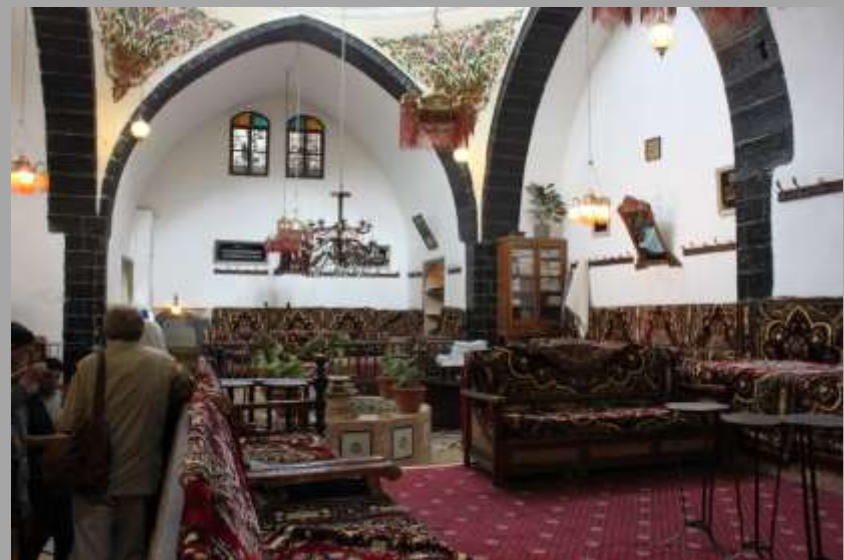
Eingang zum typischen türkischen Bad