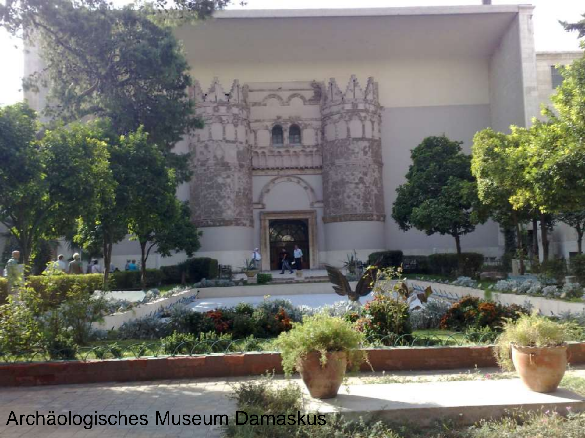
Archäologisches Museum Damaskus