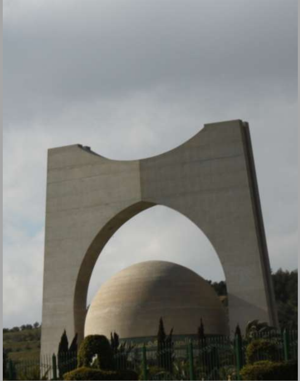
Monumente für Märtyrer