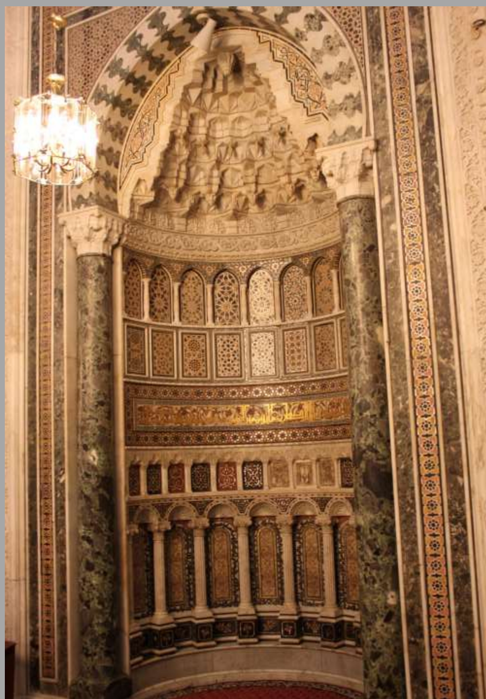
Gebetsnische - Mihrab