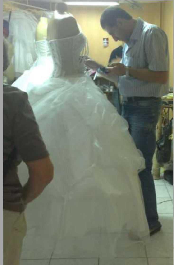
Ein Hochzeitskleid wird geklebt