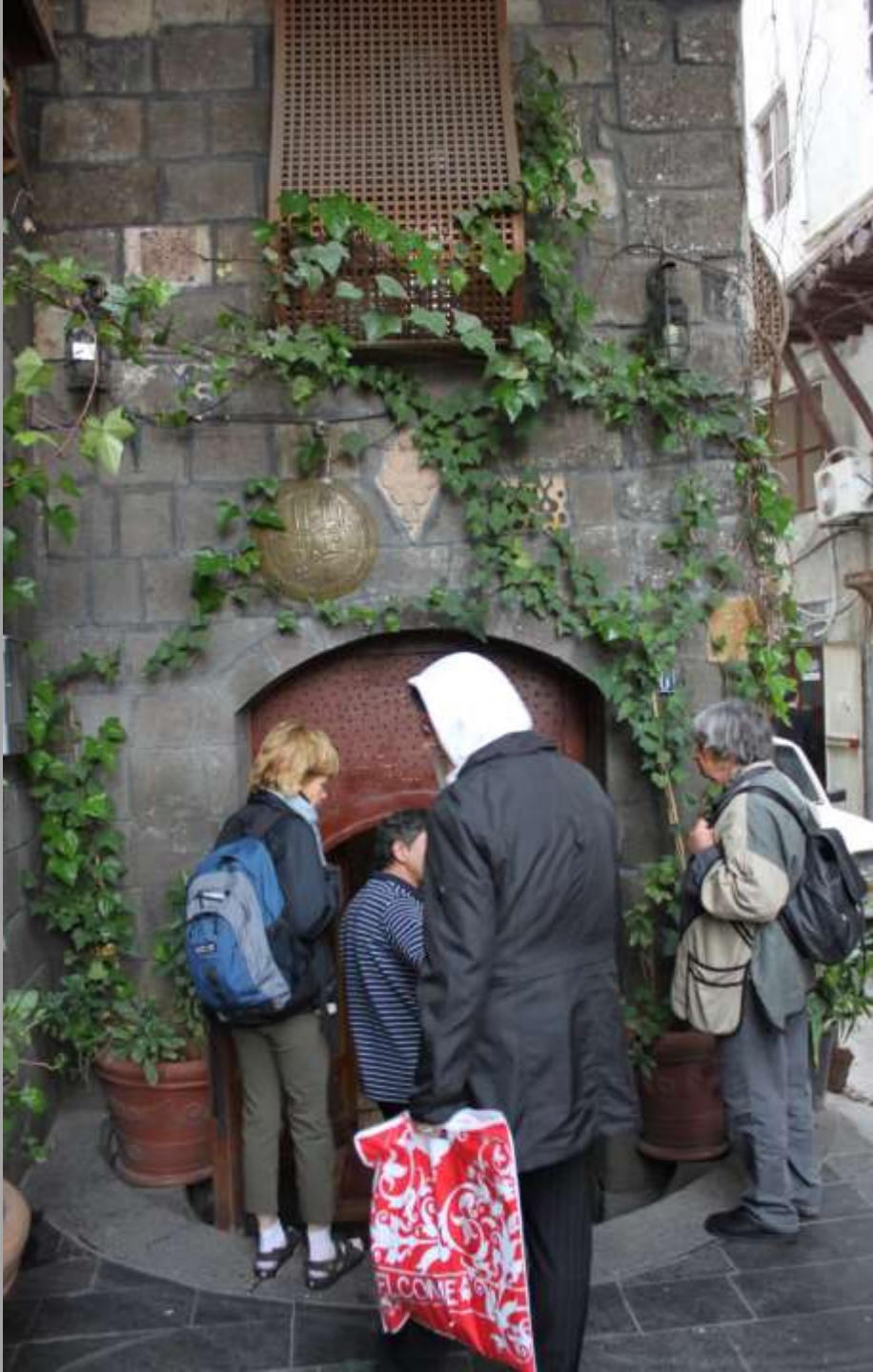
Eingang ins Bürgerhaus