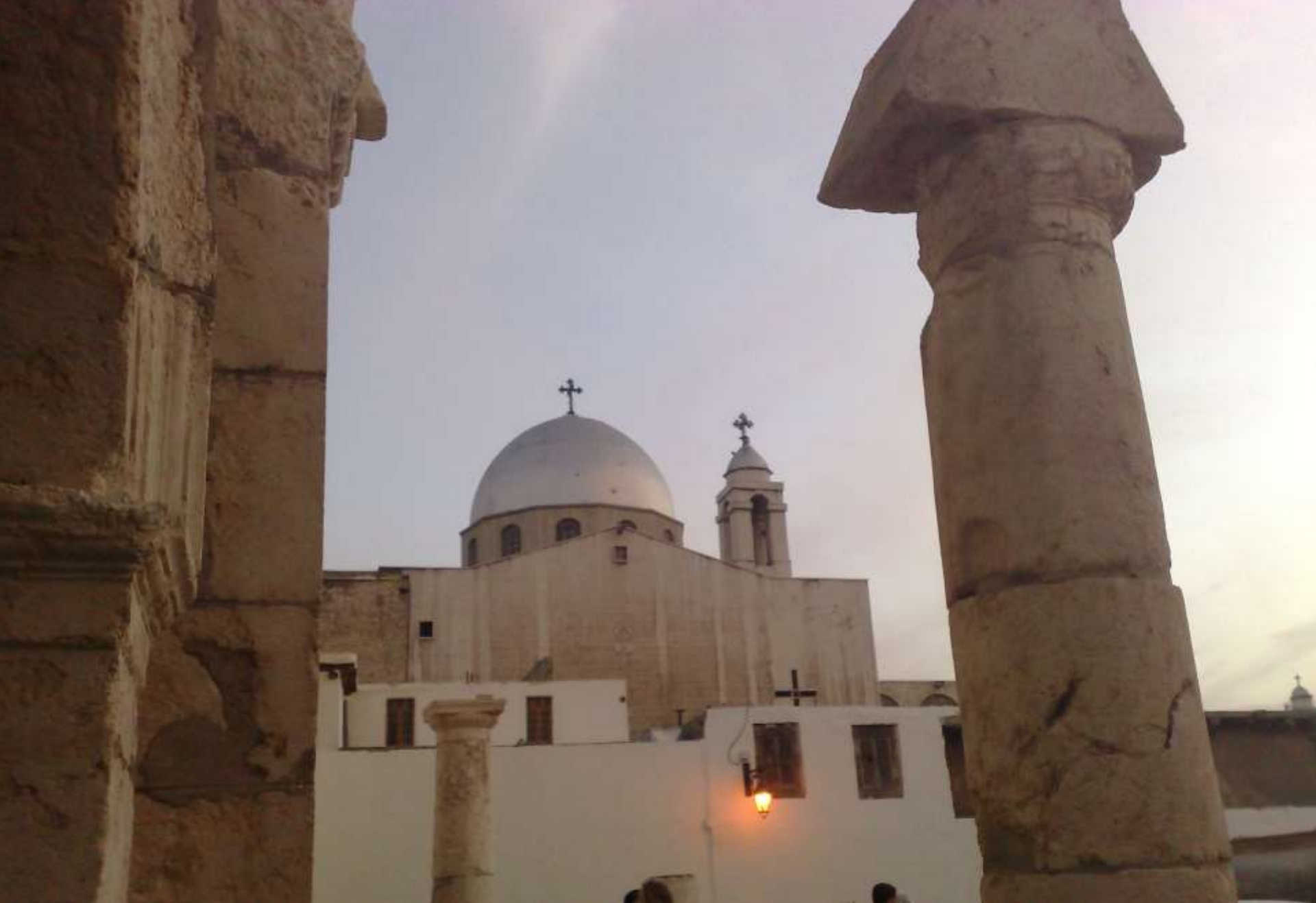
Ananias-Kapelle und Tor in der römischen Stadtmauer