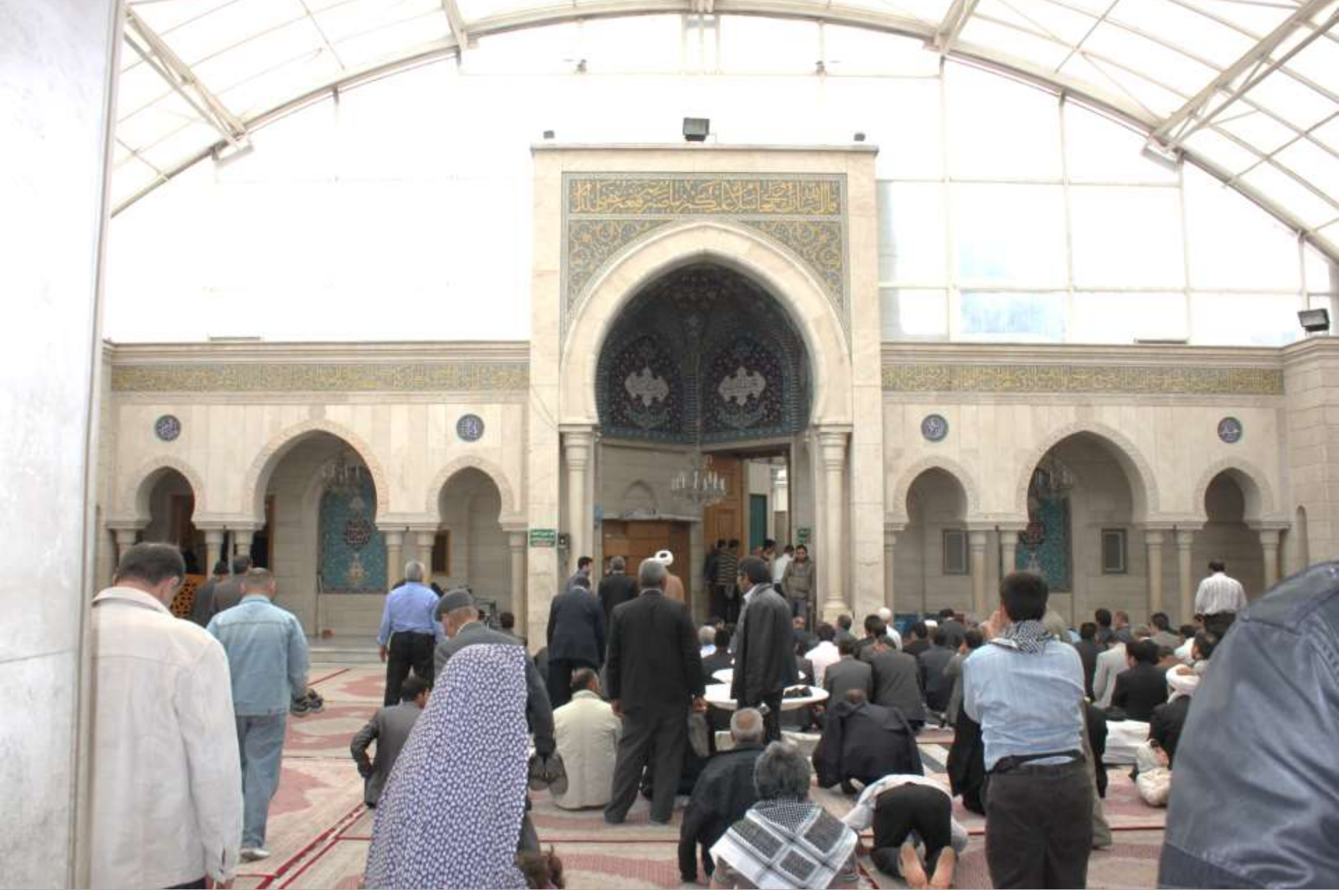
Moschee der Say'yada Roqayya