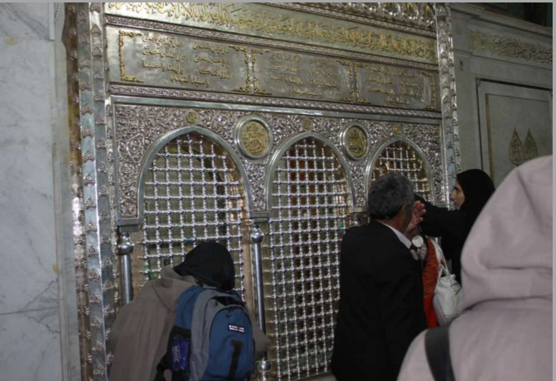
Schrein des Enkels des Propheten