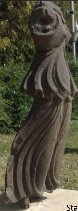
Statuen aus Bosra( Theater)