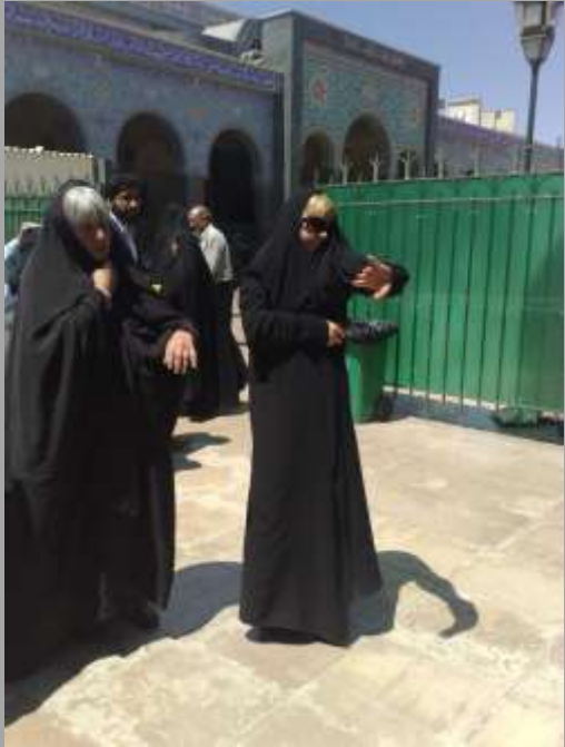
notwendig für Pilger