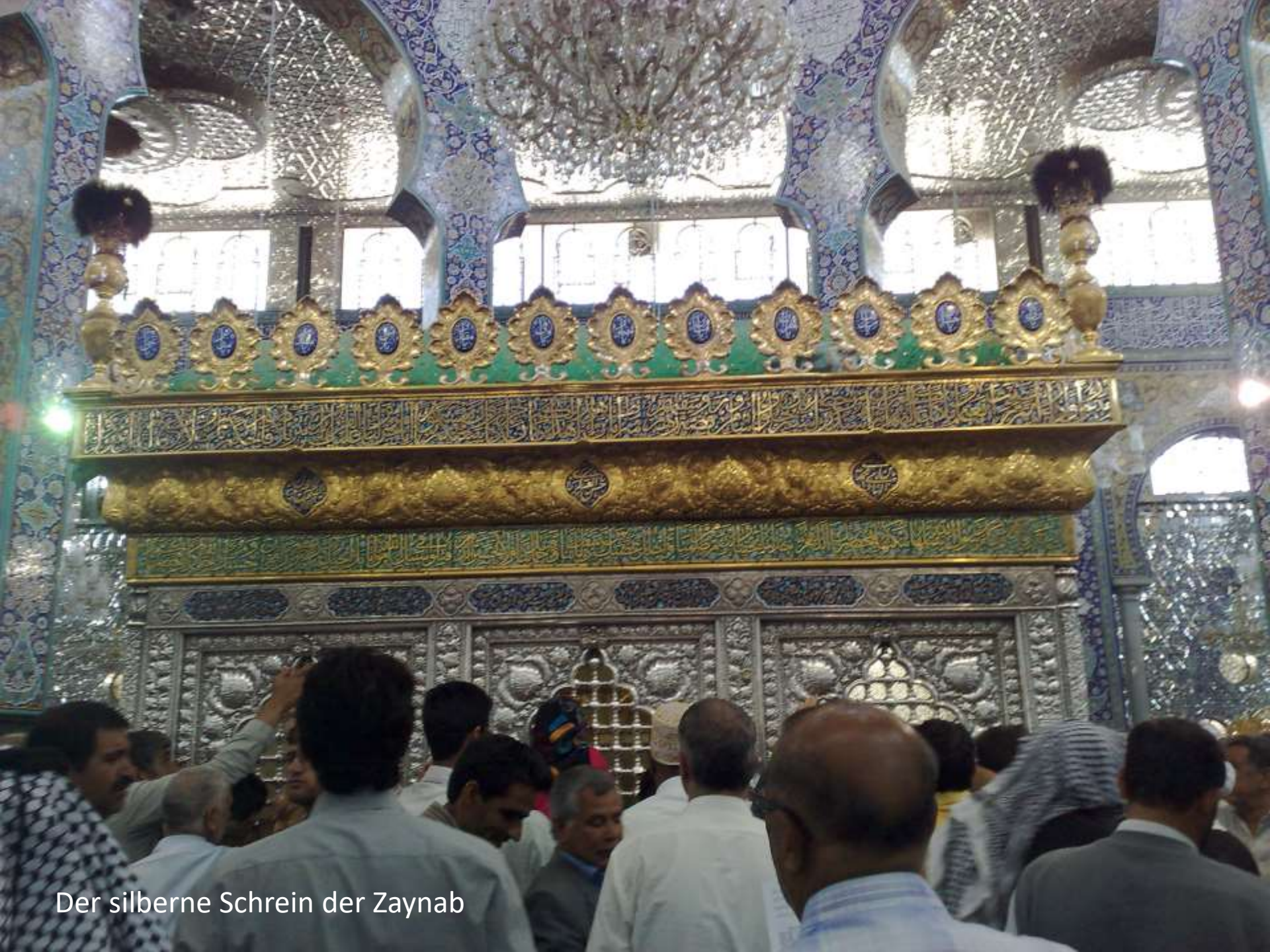
Der silberne Schrein der Zaynab