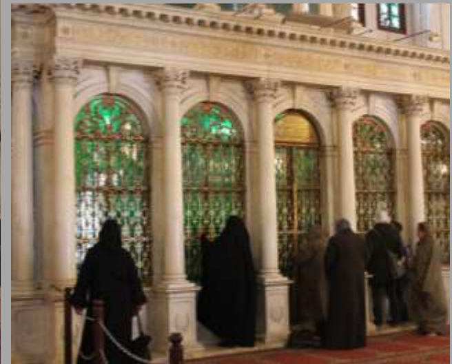
Schrein mit Haupt des Johannes des Täufer