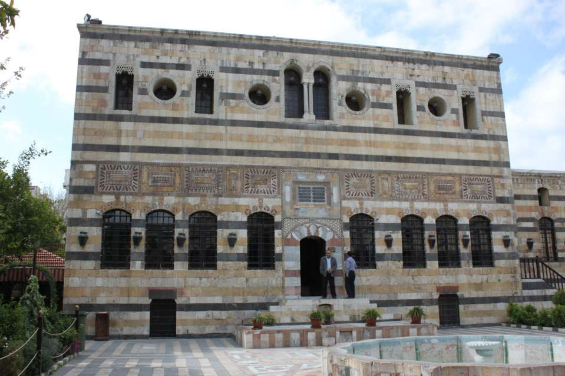
Innenhof des Azam-Palastes