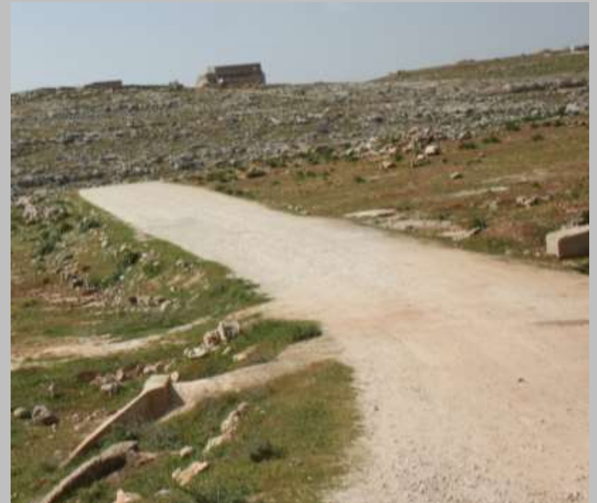
Kalksteinmassiv- nordwestlich von Aleppo