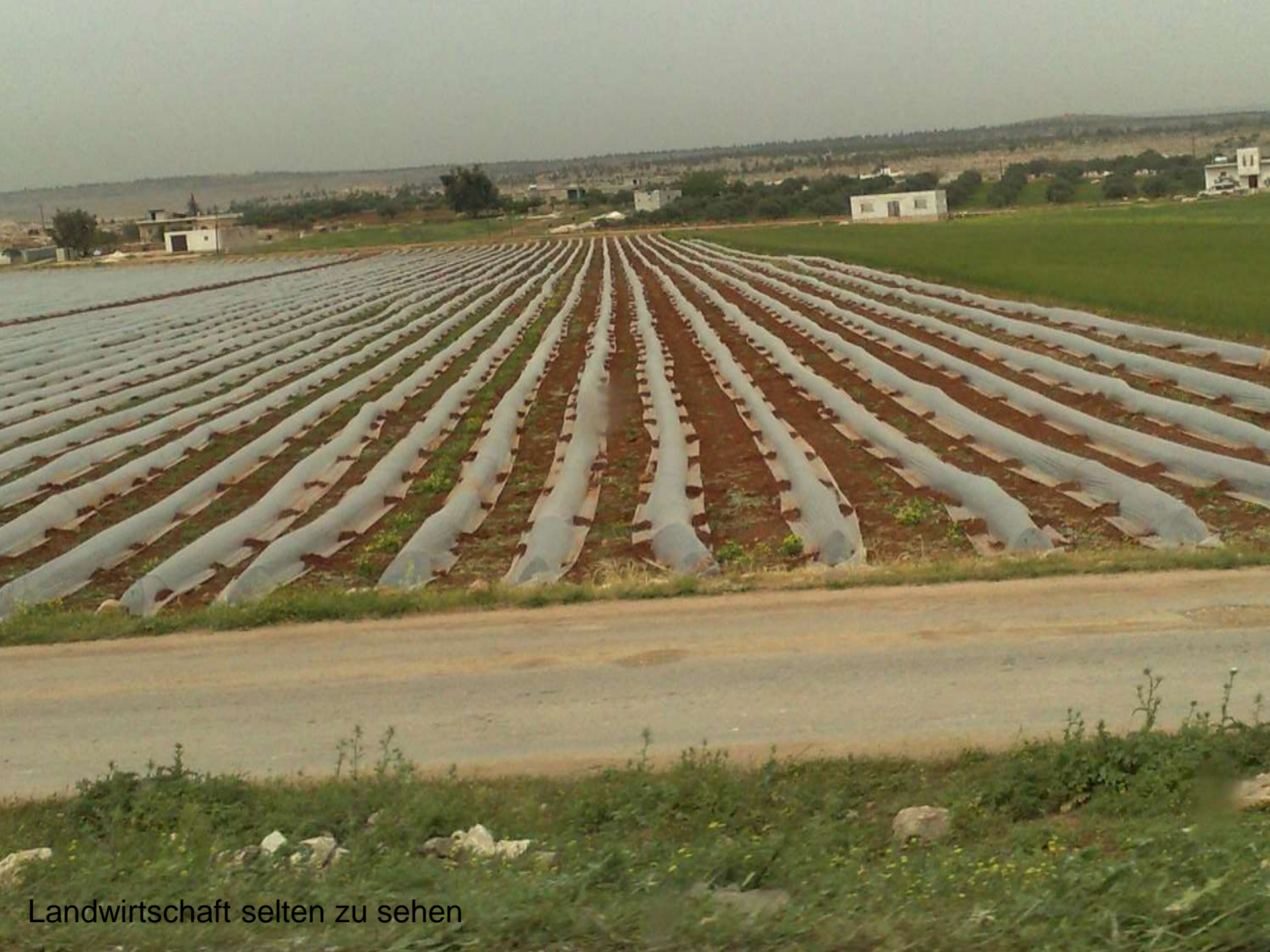
Landwirtschaft selten zu sehen