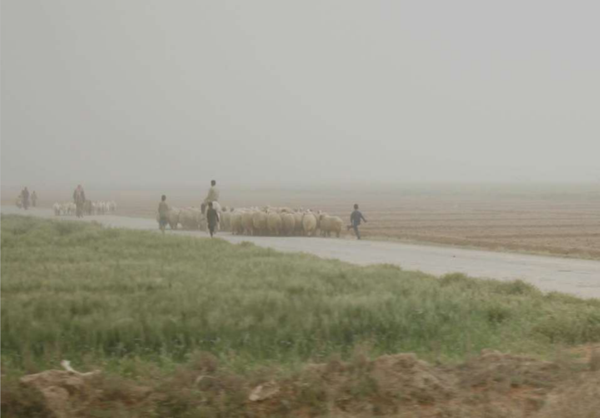
am Euphrat, wenn Sandsturm naht