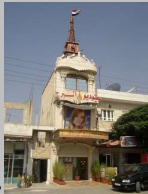
Östlich von Aleppo