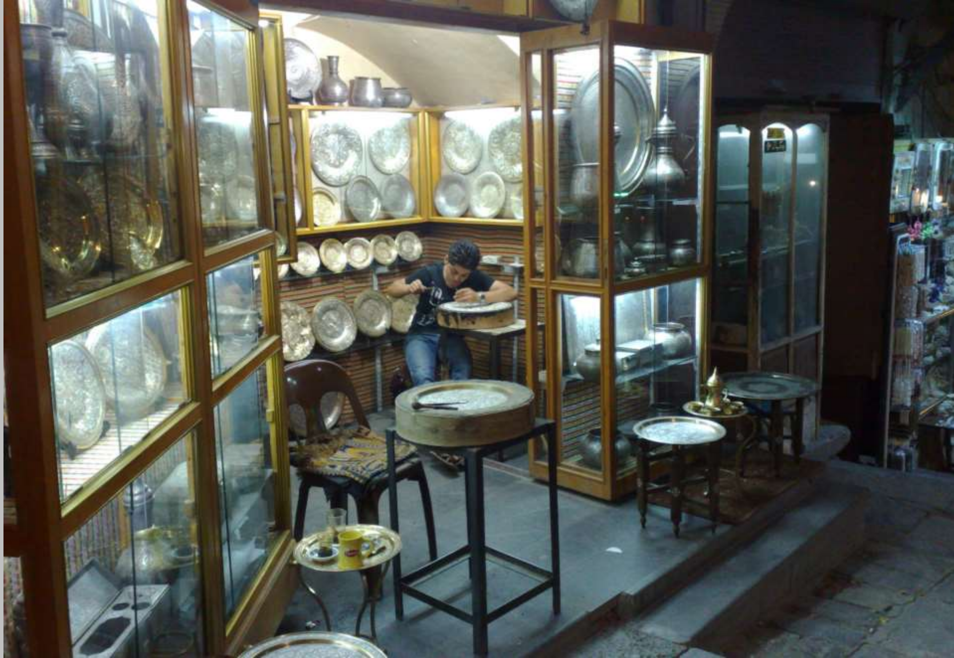
2008 Juwelier am Abend