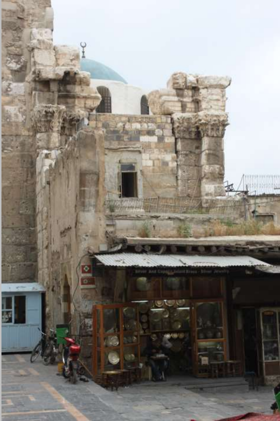
Graveure an der Umayyadenmoschee 14.04.2011