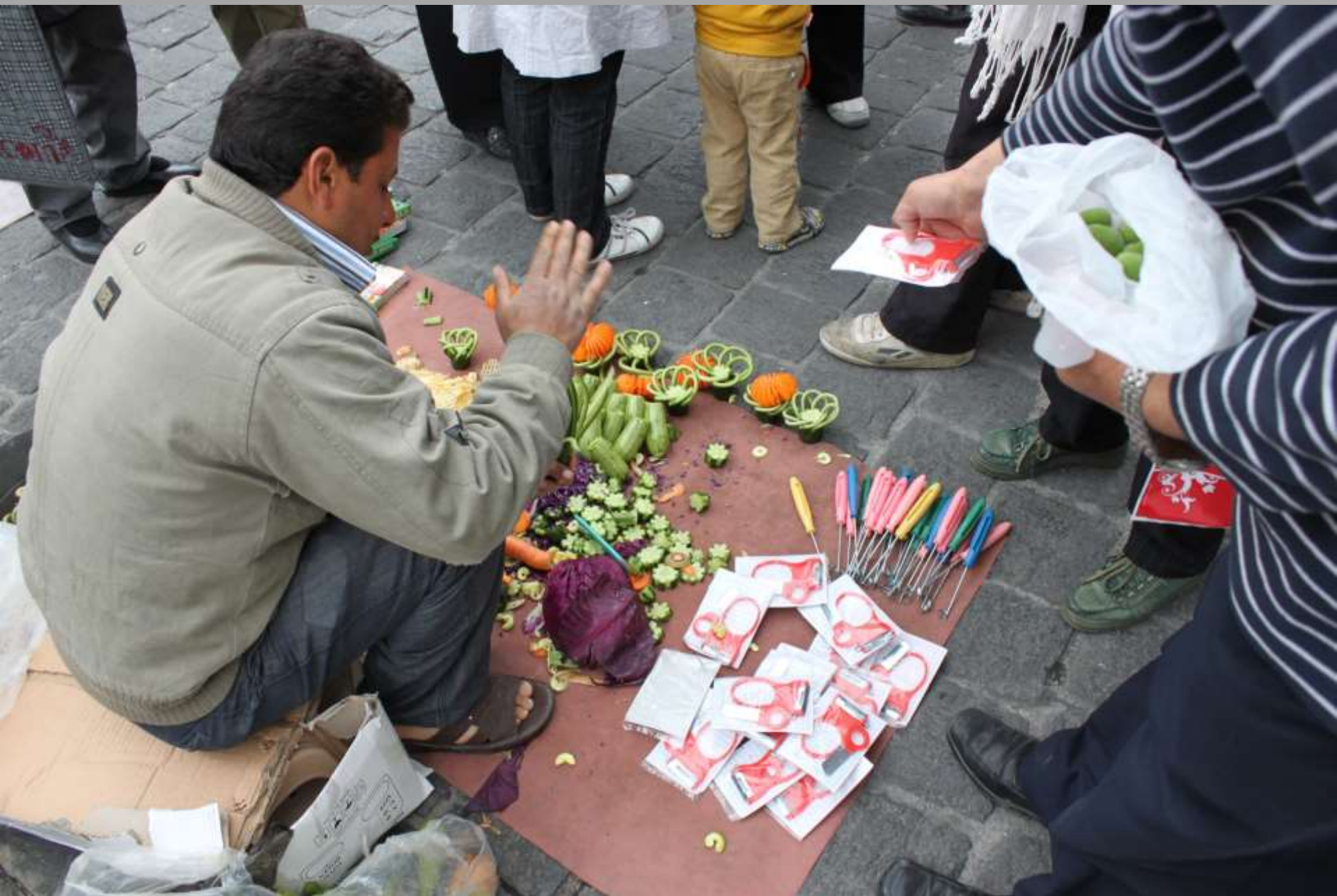
Küchenhilfe auf der Straße