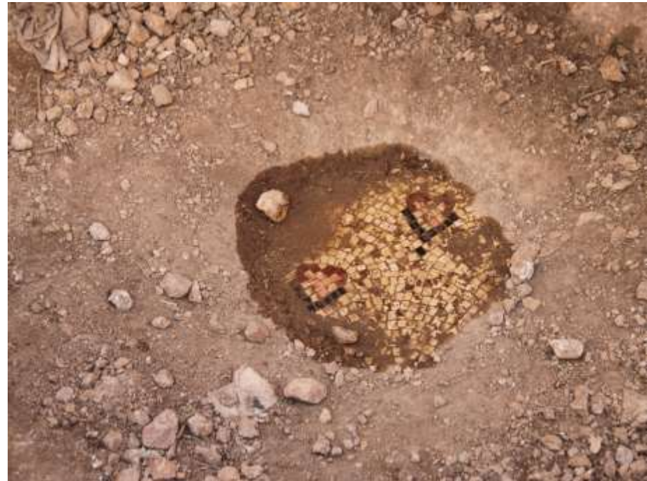
Reste eines Bodenmosaiks