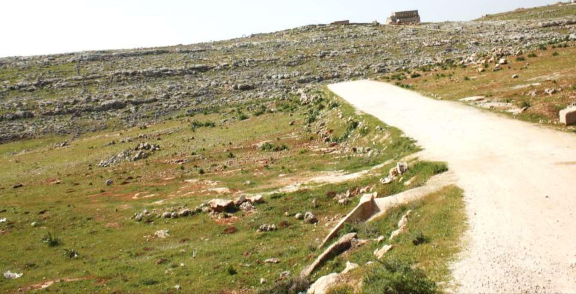
Tote Städte im nördlichen Kalksteinmassiv mindestens 820 Ruinenstädte Blütezeit 4.-7. Jh.