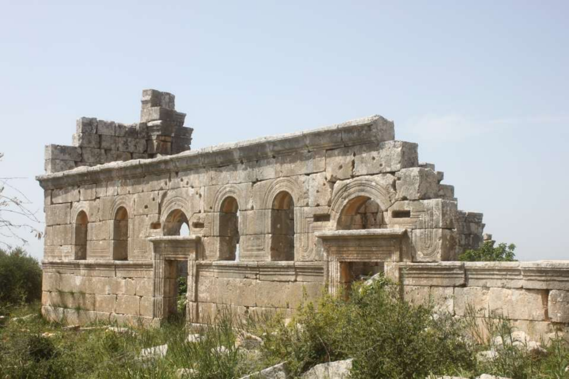
Basiliken aus der frühchristlichen Zeit