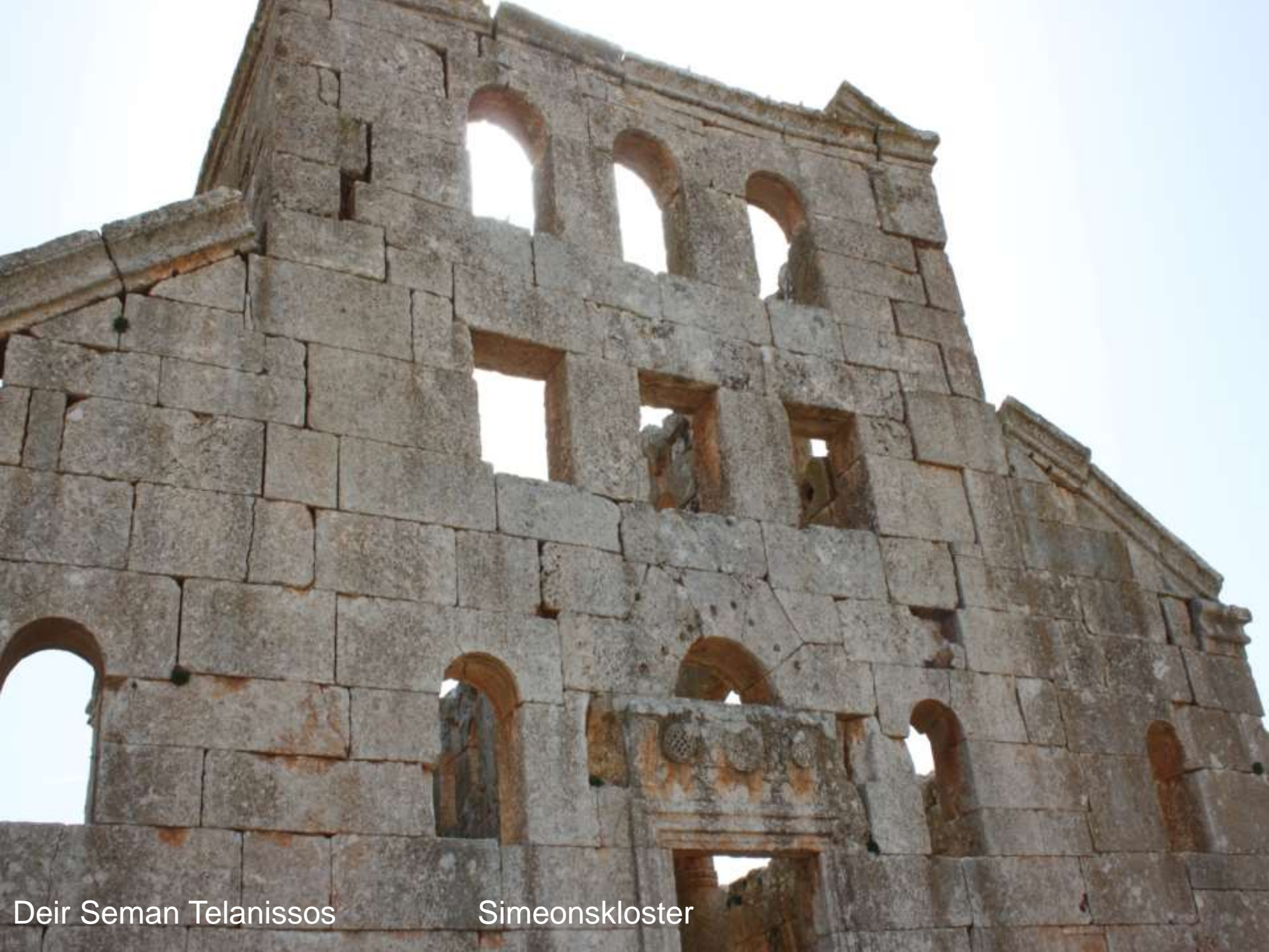
Deir Seman Telanissos